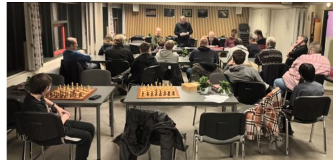
Formanden afgiver beretning om det forgangne år