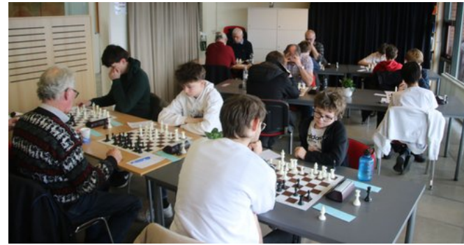
Grupperne 8 og 9