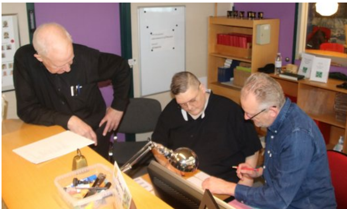
Kampledertrioen i gang med rundelægning i gruppe 9