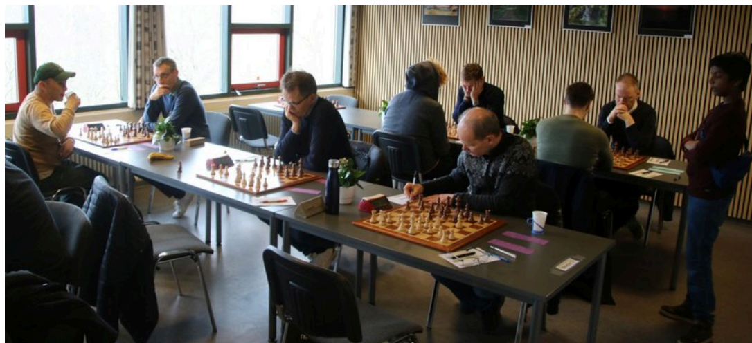
Gruppe 1 og 2