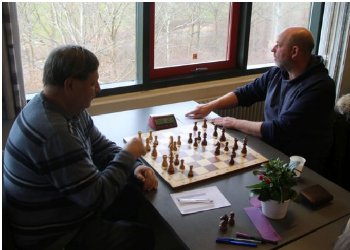
Lokalopgør i gruppe 4